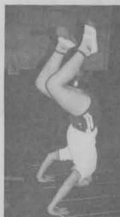
頭倒立に挑戦 (4年生)

宝塚市教育委員会の指定「自ら学ぶ子どもに育てる」ことをテーマに11月18日(金)午後より公開研究会が行われました。 新しい学力観の視点に立つ授業実践をめざして、音楽科での総合的学習や環境教育、体育科での授業が行われ、多数の参加者から好評をいただきました。