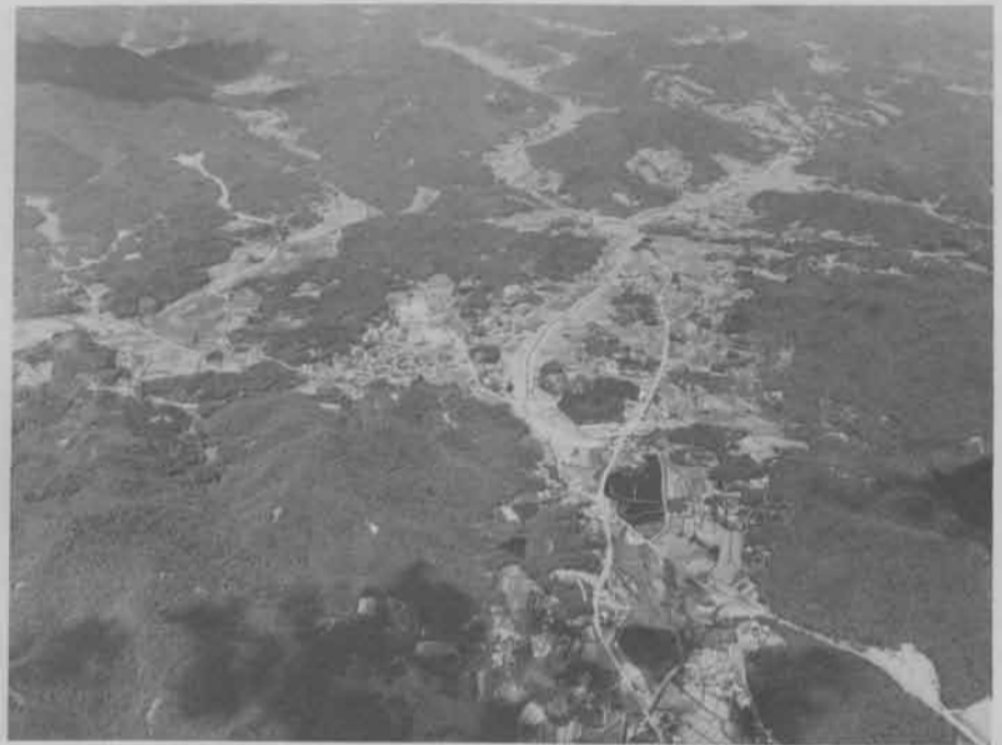
平和な年でありますように