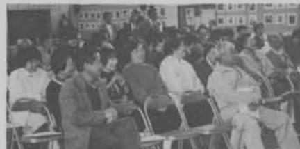
巧みな話術にドッと笑いが— 「思い当たる事、あるある」