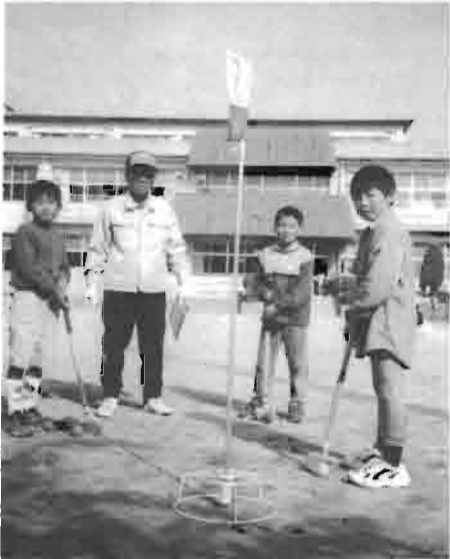
「タ・ノ・シ・イ・ヨ!」