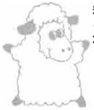
平成3年生まれ 北脇 翔太(長谷)