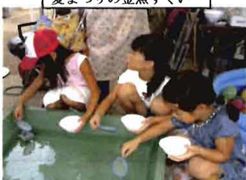
夏まつりの金魚すくい