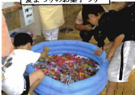
夏まつりのお菓子つり