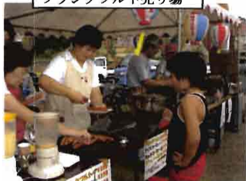
フランクフルト売り場