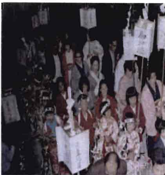
夜に行われる稚児行列